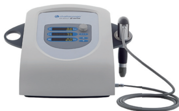
インテレクト RPW モバイル